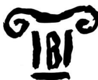
Instytut Badań Interdyscyplinarnych „Artes Liberales” UW

Uniwersytet Ekonomii i Prawa „KROK” w Kijowie