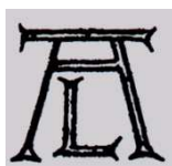
Fundacja „Instytut Artes Liberales ” (FIAL)