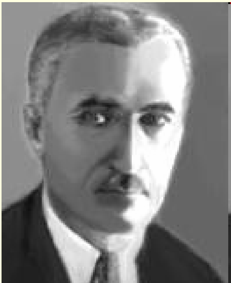
Дмитро Миколайович Узнадзе