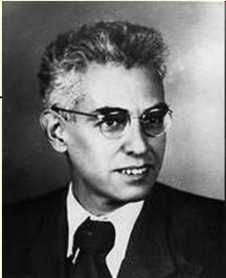
■ Олекса́ндр Рома́нович Лу́рія